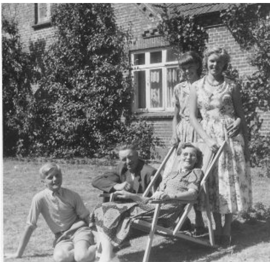
Foto fra mit fødehjem "Teglvang" i 1952. Den lå hvor der nu er to rundkørsler over motorvejen mellem Hammerum og Ikast. På østlig retning fra kørslen 39 HI-Park, lå stuehuset.