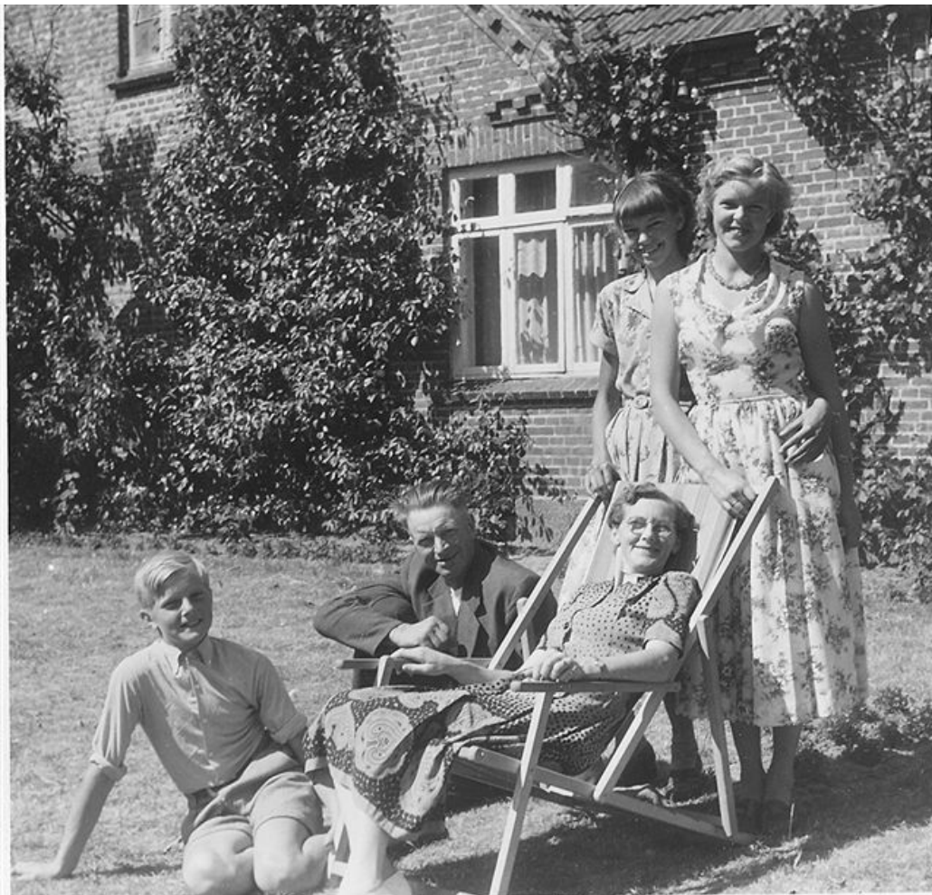
Alle 5 i haven 1954