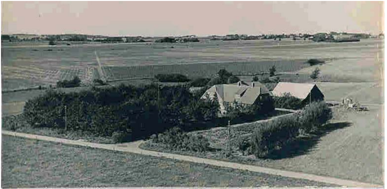
Teglvang ca. 1954